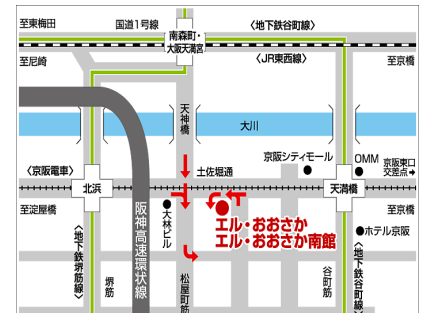
エル・おおさか案内図